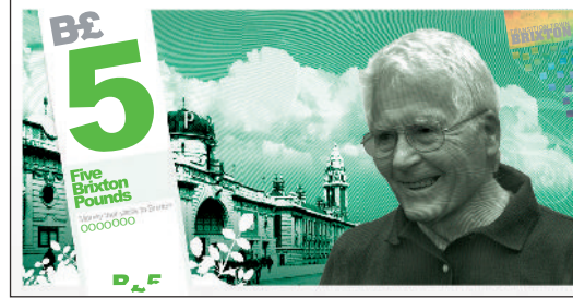
B£5 with James Lovelock