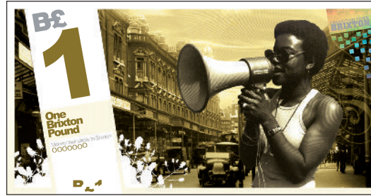
B£1 with Olive Morris

El B£ puede ser usado con un número creciente negocios independientes participantes de Brixton. Es altamente seguro: los billetes están impresos en papel especial por una imprenta especializada, incorporan un holograma propio, en relieve, numerados y con otras medidas de seguridad.