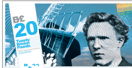
B£20 with Vincent Van Gogh