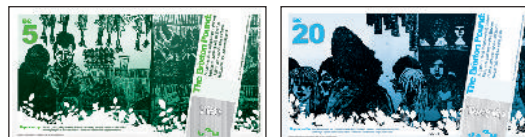
Reverse of notes