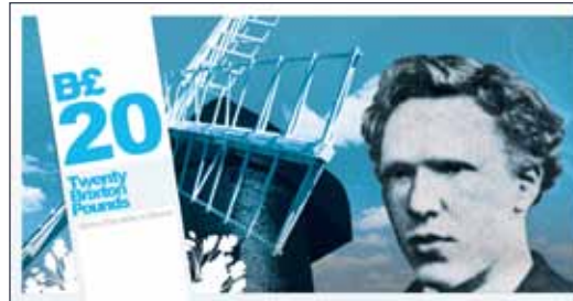
B£20 with Vincent Van Gogh