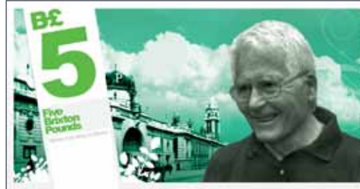
B£5 with James Lovelock