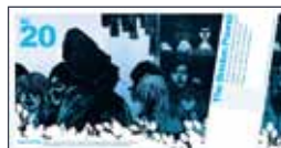
Reverse of notes